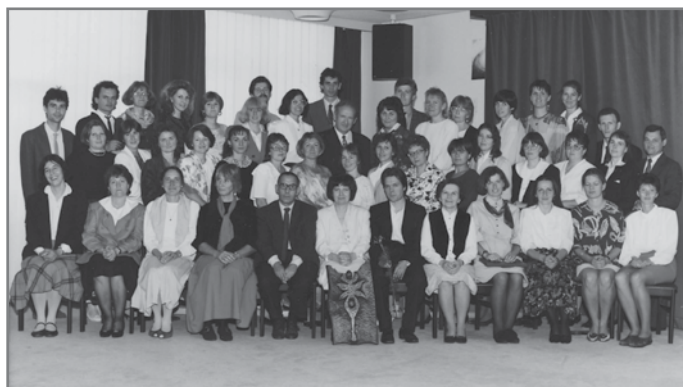
Az 1. Waldorf-csoport (Budapest, 1992)

szabályok értelmében a mindenkor pedagógus alaptanúsítvány kiadása megköveteli a Waldorf-pedagógiai végzettség megszerzése után is, hogy kit lehet tanítónak, illetve tanárnak tekinteni. (Éppen ezért soroljuk a diplomát nem adó posztgraduális továbbképzések közé.) A kétévente indított 40-45 fős csoportokból az eddigi közel húsz év során mintegy 380 hallgató szerzett tanúsítványt. Közülük igen magas arányban (70-75%-ban) kaptak pedagógusállást Waldorf-iskolákban. A természetes munkahelyváltás, a gyermekvállalás, illetve a hazai vagy külföldi tanulmányok miatt a Waldorf-iskolai alkalmazás időtartama egyénenként különböző. A végzettek közül számos tanár/tanító vett részt iskolaalapításban: Budapesten a kamaraerdei, a kispesti, a rákosmenti, az óbudai Waldorf-iskolákban, illetve a debreceni, a dunakeszi, a fóti, a gödöllői, a győri, a jászszentandrásai, a miskolc-hámori, a nemesvámosi, a nyíregyházi, a solymári, a szolnoki, a szombat-helyi, a váci és további Waldorf-iskolákban.