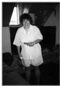
Felbédés (Kolozsvár, 1998)

Az 1–7. csoportok számára minden nyáron szerveztünk egyhetes, bentlakásos nyári táborokat, amelyeknek az volt a céljuk, hogy a bio-dinamikus gazdálkodás alapjai, a művészeti és kézműves foglalkozások, a fafaragás, a drámapedagógiai gyakorlatok mellett a hallgatók megismerjék az ország egyes tájait (Órség, Hortobágy, Zempléni hegyek, Ormánság, Szigetköz, Somogyi dombvidék stb.), illetve egyes nagyobb településeket (Debrecen, Pécs, Sárospatak, Kolozsvár, Balaton-parti települések stb.) kulturális értékeit.