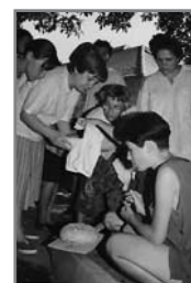
Kenyérsütés (Drávafők, 1995)

• Bevezettünk olyan tanulási módszereket, amelyek nagymértékben elősegítik a hallgatók aktív bekapcsolódását a közös munkába. A hallgatók hétről-hétre, illetve hosszabb határidőre elvégeznek/készítenek különböző feladatokat (megfigyelések, irodalom feldolgozása, epochák, illetve főoktatás tervezése, zenei és mozgásgyakorlatok, szépirodalmi szövegek gyűjtése, pedagógiai naplók, a tanulmányaik alapján gyűjtött anyagokból az ún. Waldorf-könyv elkészítése stb.).