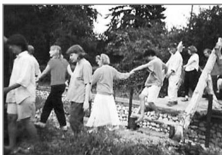
Hidépítés (Miskolc-Hámor, 1994)