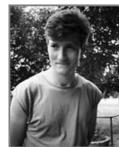
Merengés (Iváncsa, 1992)

• Az országban működő 25 Waldorf-iskola közül 19 iskola alapításában vettek részt a Bárczi-n végzett Waldorf tanítók/tanárok, illetve volt hallgatóink mind a 25 Waldorf-iskolában tanítanak osztálytanítói és szaktanári munkakörben.