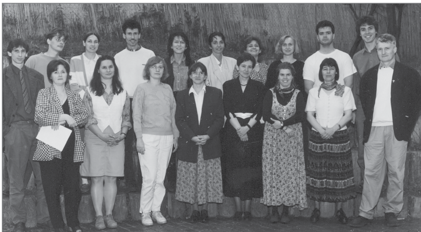
Tanári Kollegium 1995-96-ban