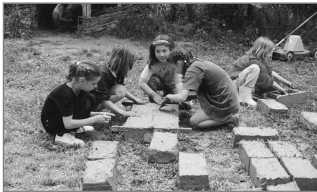
Válogatás a 89-es évben

– Te vagy iskolánk első osztálytanítója, két osztály életét kísérted végig. Hogyan látod az iskolát? Milyen változásokon mentünk keresztül ez alatt a 20 év alatt?