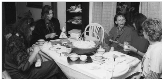
Készülődés a bazárna