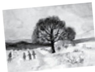
Balázsovits Zsuzsanna: December